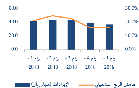
الإيرادات الربع السنوية (مليار ريال) وهامش الربح التشغيلي (%)

مصدر المعلومات: وكالة بلومبرغ، إدارة الأبحاث، شركة فالكم: البيانات في يوم 13 مايو 2019